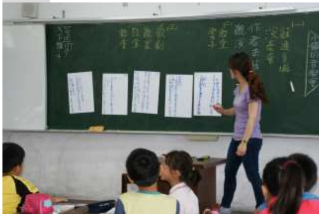
說明五：全班針對小組討論結果再尋求共識