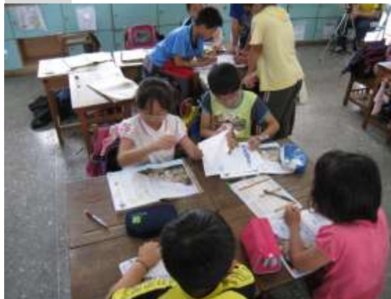
說明六：小組分組討論