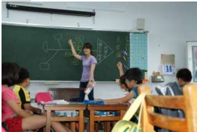
說明三：使用魚骨圖分析課文人、事、時、地