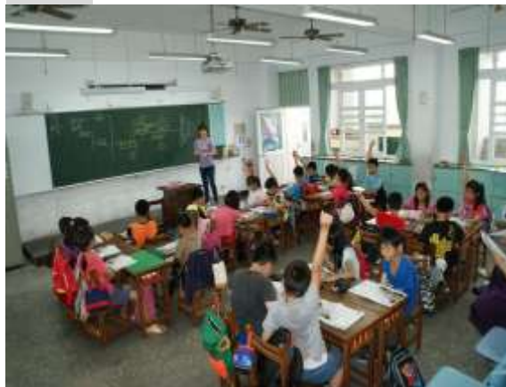
說明四：課文提問回答