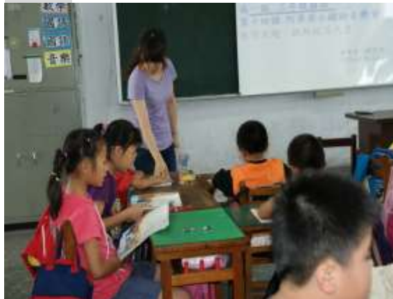
說明二：指導學生美聲朗讀