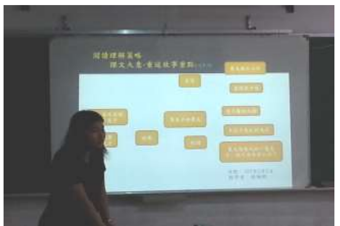
說明六 老師總結-心智圖