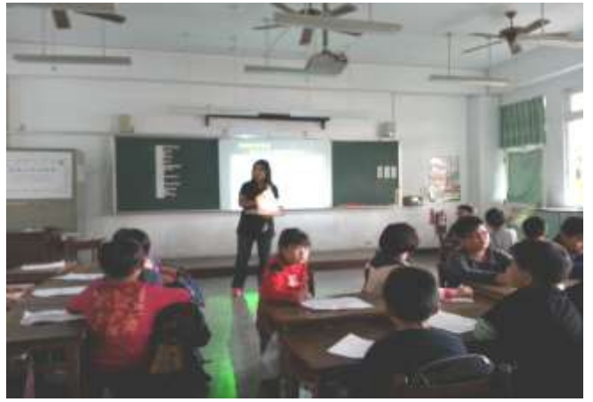
說明二 說明各組討論內容