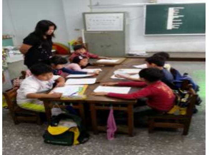
說明四 各組討論故事起因、經過、結果