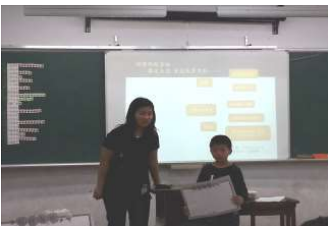
說明五 小組發表討論結果