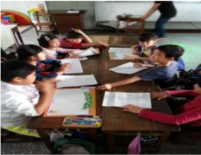
說明三 各組討論故事起因、經過、結果